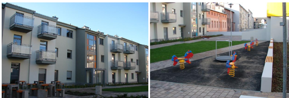
Widok Budynku mieszkalnego w którym usytuowane jest trzecie mieszkanie rodzinkowe oraz plac zabaw we wnętrzu kwartału.

Kolejne, trzecie mieszkanie rodzinkowe oddano w przebudowanym kwartale śródmieścia Stargardu. Zlokalizowano je w kamienicy, przy ul. J. Piłsudskiego 103, wewnątrz kwartału poddanego wcześniej rewitalizacji. W lokalu o powierzchni użytkowej ok. 220 m. kw. zamieszkało czternaścioro wychowanków stargardzkich domów dziecka. Mieszkanie składa się z sześciu pokoi jedno- dwu- i trzyosobowych. Młodzi lokatorzy mogą także korzystać z pomocy psychologa, pedagoga, terapeuty oraz pracownika socjalnego. Każde z dzieci ma do swojej dyspozycji również pokój dzienny, połączony z kuchnią- jadalnią, spiżarnią, pralnią, pomieszczeniem gospodarczym, łazienkami i toaletami. Wewnątrz kwartału zadbano o mini- plac zabaw, zlokalizowany na niewielkim skwerku, dostępnym również dla lokatorów nowych mieszkań.