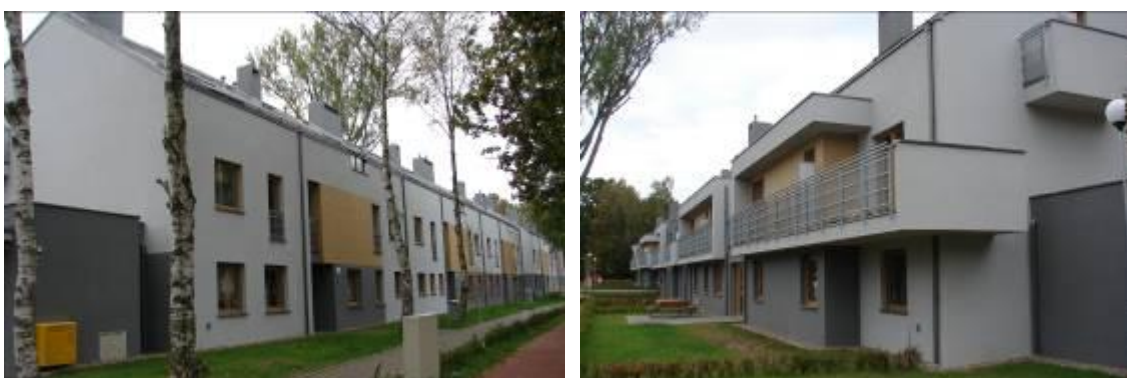
Widok Budynku mieszkalnego w którym usytuowane jest pierwsze mieszkanie rodzinkowe