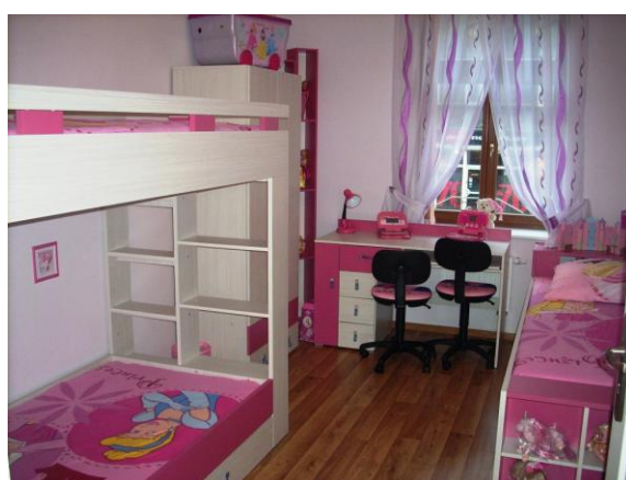
Mieszkanie rodzinkowe w budynku przy ul. Piłsudskiego 103 - pokój dzienny i pokój-sypialny.