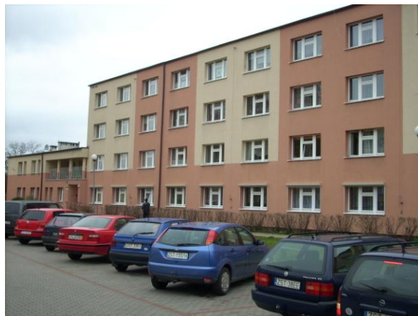
Widok Budynku mieszkalnego w którym usytuowane jest drugie mieszkanie rodzinkowe

Drugie już mieszkanie rodzinkowe dla wychowanków domu dziecka, przekazało Stargardzkie TBS Sp. z o.o. w budynku dawnego internatu, przy ul. Karola Szymanowskiego 56 w Stargardzie Szczecińskim.