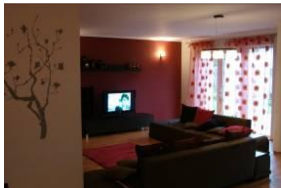
Mieszkanie rodzinkowe w budynku przy ul. Śniadeckiego 3 – jadalnia z kuchnią i pokój dzienny.