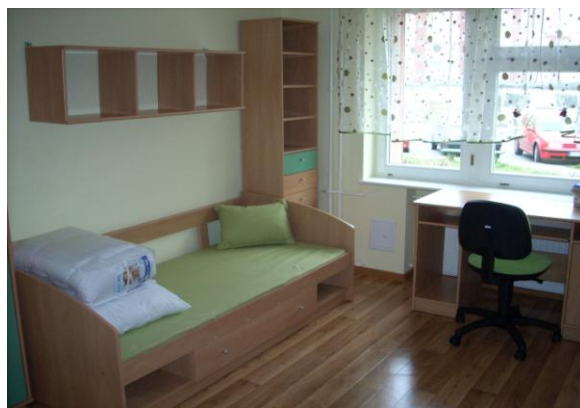
Mieszkanie rodzinkowe w budynku przy ul. Szymanowskiego 56 - pokój dzienny i pokój-sypialny.